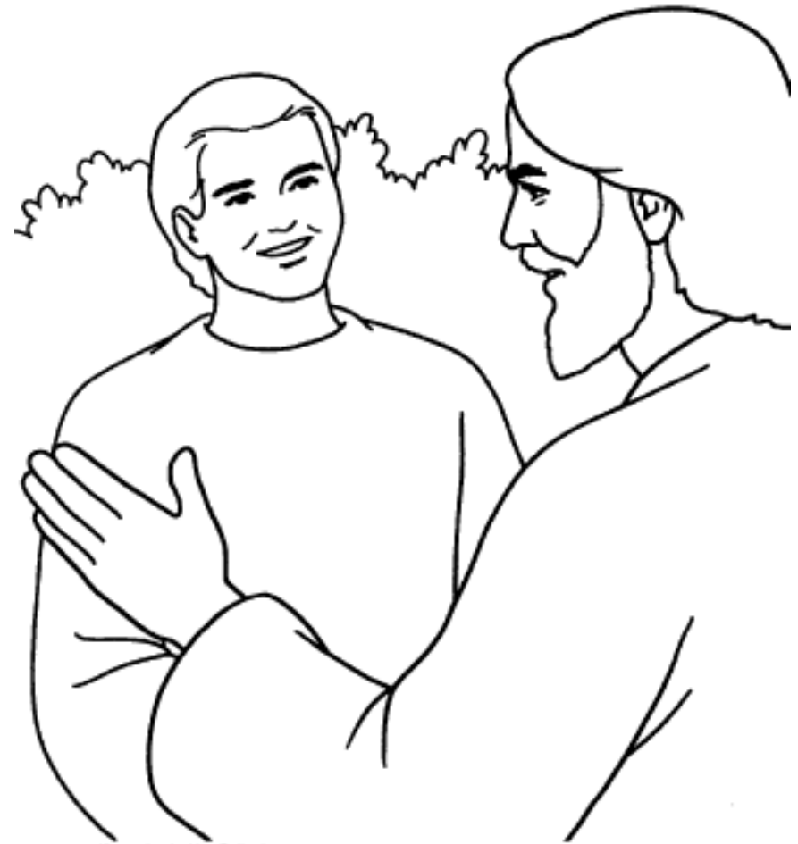
Illustration by Nan Pollard. © 1998 Standard Publishing. Used with permission.